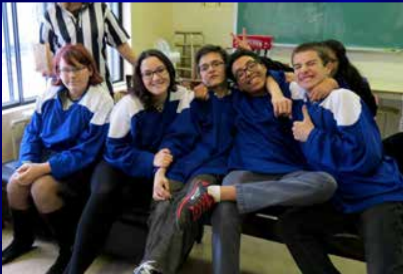
La ligue d'impro