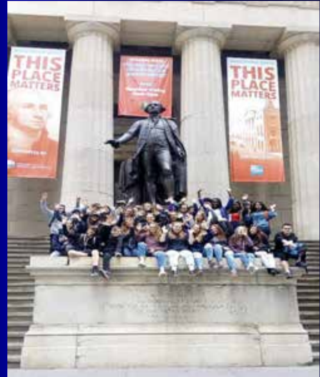
Voyage à NEW YORK