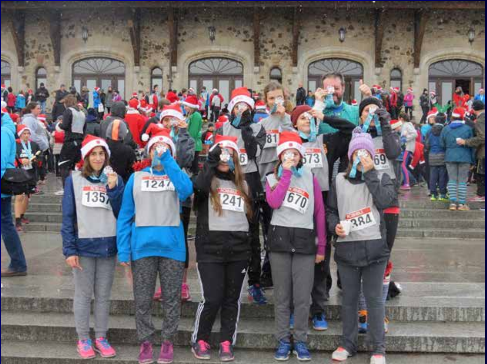
Vio2max - course