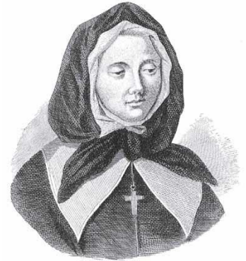
MARGUERITE BOURGEOYS. Reproduction des épreuves de la Congrégation de l'Immaculée.

Le 30 avril 1658, elle nettoie l'étable de pierres de la commune pour ouvrir sa première école. On situe l'emplacement de l'étable-école au 50 ouest de l'actuelle rue Saint-Paul à Montréal. Marguerite Bourgeoys a ouvert des écoles à Champlain, Pointe-aux-Trembles, Lachine, Sainte-Famille, l'Île d'Orléans et Château-Richer.